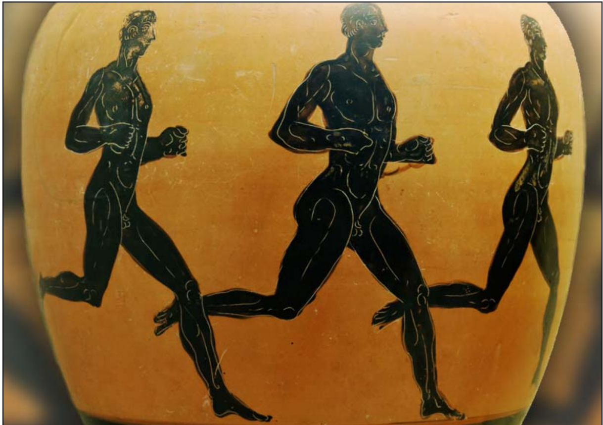
Quelle: Drei Läufer, attische schwarze Vasenmalerei, Foto: Wikimedia, Marie-Lan Nguyen